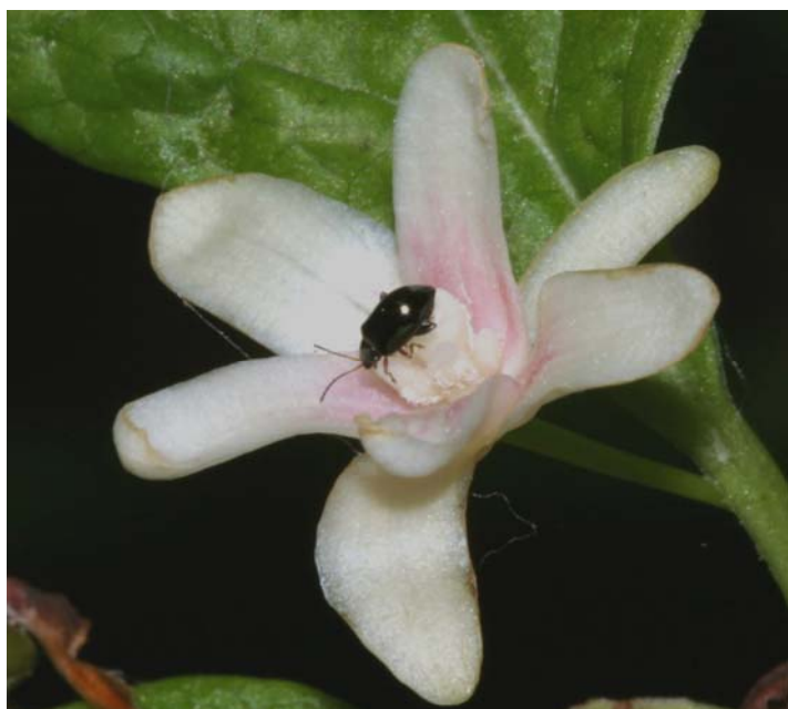
図4. チョウセンゴミシに訪花した鞘翅類