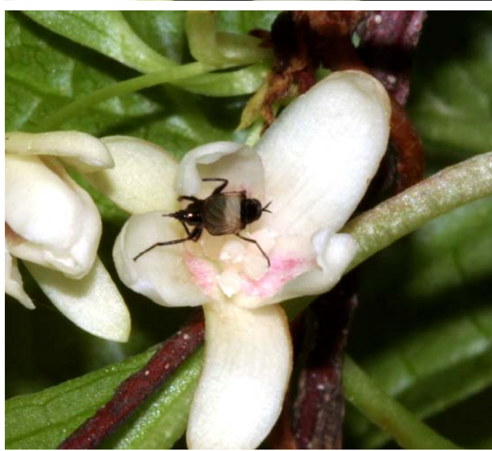
図3. チョウセンゴミシに訪花した双翅類(2)