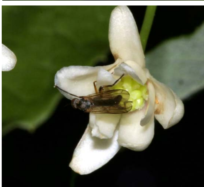
図2. チョウセンゴミシに訪花した双翅類(1)