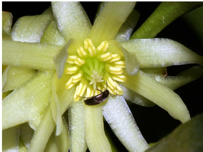
図16. シキミの花を訪れた鞘翅類(2)