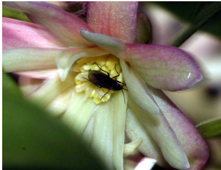
図17. シキミの花に訪れた双翅類(1)