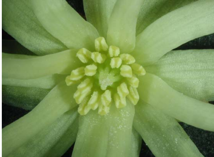
図14. シキミの花。左は雌性期、右は雄性期