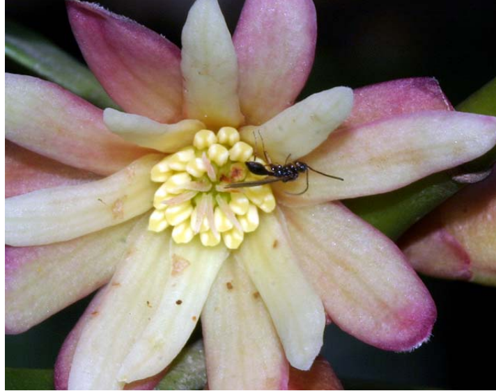
図19. シキミの花を訪れた膜翅類