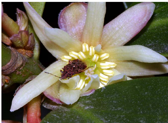
図15. シキミの花を訪れた鞘翅類(1)