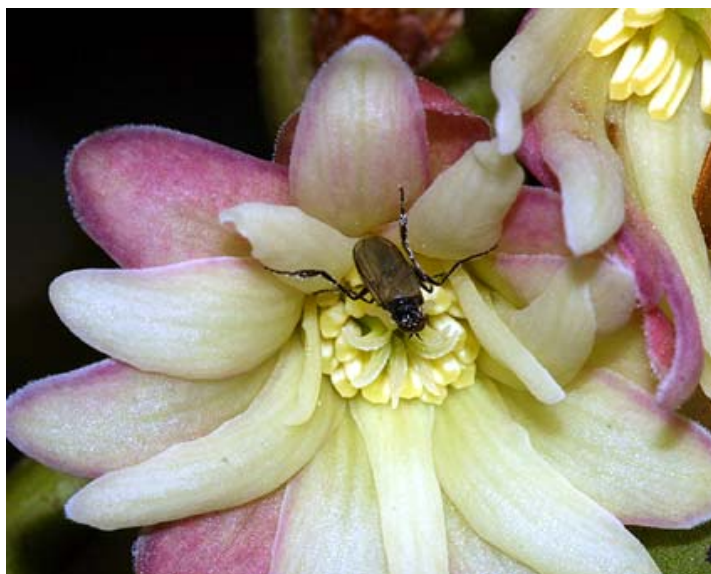
図18. シキミの花を訪れた双翅類(2)