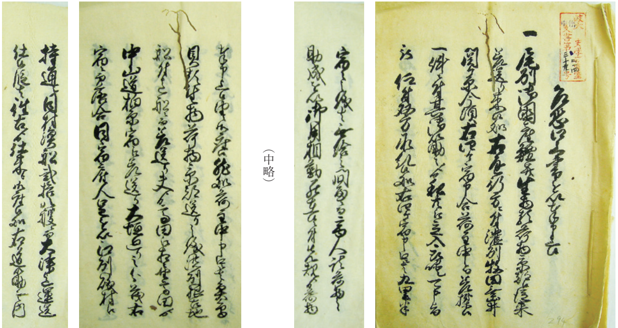
(岐阜大学教育学部郷土博物館所蔵 美濃国池田郡八幡村竹中家文書ち 214 の一部抜粋、以下、特に所蔵を明記していない史料は、教育学部郷土博物館所蔵のもので、教育学部郷土博物館は「博物館」と記載します)

この古文書は、天保7年(1836)に作成された書類の一部分です。はじめに「一、尾州御国産鰻并生物類荷物、京都江従来差送り来候処」とあり、尾張国産の鰻・生物類(魚鳥貝)が京都へ運ばれていたことが見てとれます。鰻の輸送は、通常のルート(各宿場経由、下記図の緑線など)とは異なるルートが使われていました(下記図の太赤線)。なぜでしょうか?