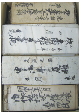
美濃国本巣郡高屋村文書の一部

本年度は、『美濃国池田郡八幡村竹中家文書目録（その2）』を刊行する予定です。これからも、岐阜県域に関わる資料の整理を進め、多くの方々に活用していただけるよう努めていきます。