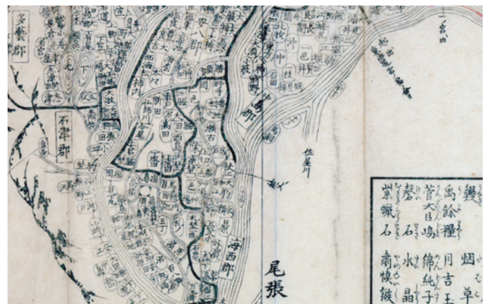
天保5年(1834)細見美濃国絵図(村絵図178) 右頁の村が確認できる箇所を範囲とした。名物土産として「鰻」がみえる。

もっとも早い事例は、「尾州蟹江」(愛知県海部郡蟹江町)の鰻です。これは、宝暦2年(1752)完成の『張州府志』にみえます(名古屋史談会編『愛知郷土資料叢書19 張州府志(復刻版)』愛知県郷土資料刊行会、1974年)。寛政年間成立とされる『濃州御行記』(樋口好古著)には、美濃国石津郡五町村(海津市)で、「又夏は鰻を多くとり、(中略)此魚鳥は高須へ売出し京師へ多く送ると云」とあり