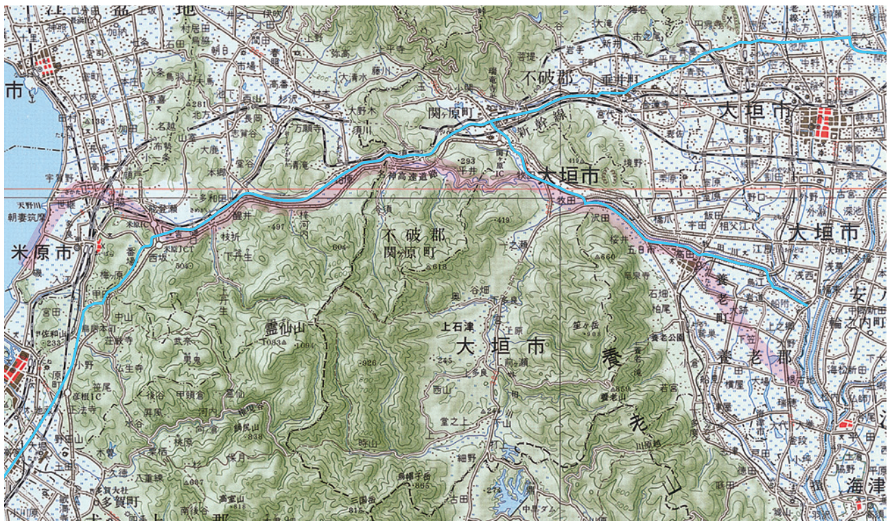
鰻など生鮮物の道筋と中山道・九里半街道（推定）