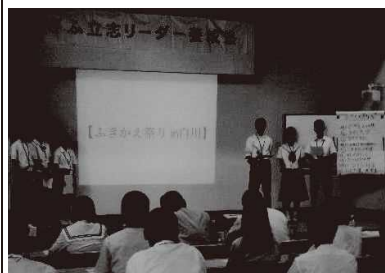
図3. 企画提案発表会の様子

企画の発想や発表の仕方について肯定的な意見も多くいただいたが、ゴールの明確化や実現の可能性、実施する際のメリット等についても助言していただいた。今後の事後活動につなげていくためにも、自分の願いや思いだけでなく、実態や課題、周りの状況等を考慮して活動を仕組むことが大切であることを学ぶことができた。以下は塾生の感想である。