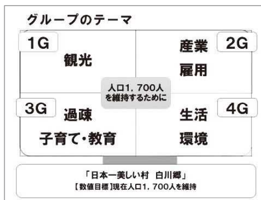
図1. 企画提案のテーマ